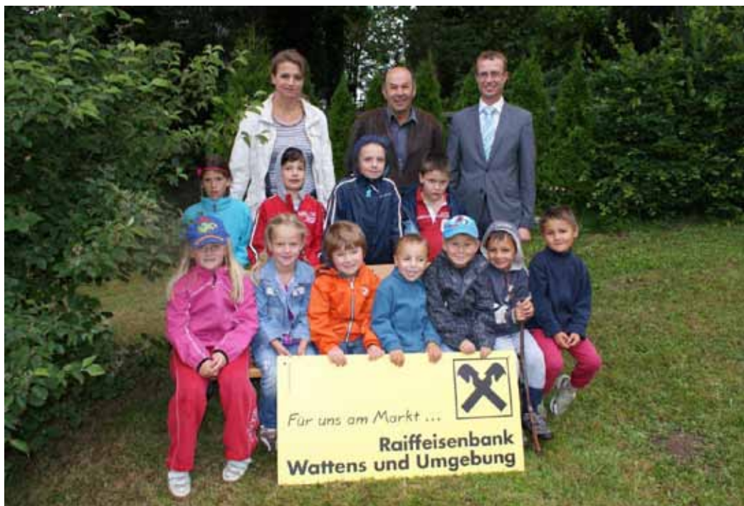
Die Raiffeisenbank Wattens spendiert eine Bank für den Spielplatz Birchach