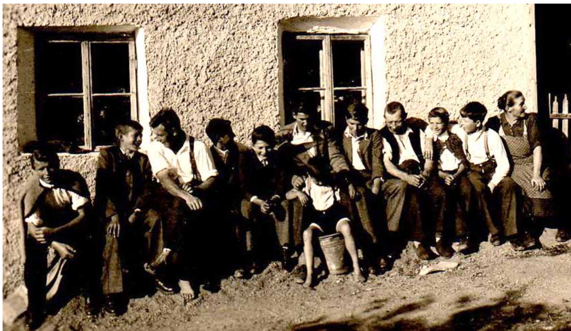
Sonntagnachmittag zu „Obersteinling“ ca. 1950