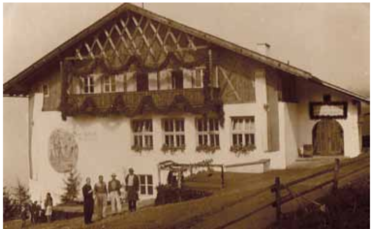
Das neue Wattenberger Schulhaus