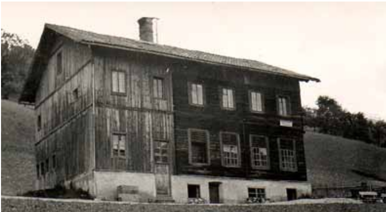
Das alte Wattenberger Schulhaus, 1906 erbaut