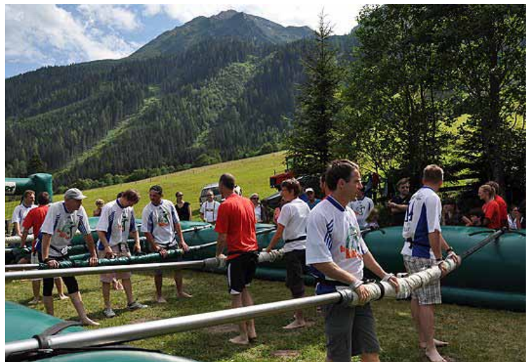
Wuzzlerturnier beim Almfest