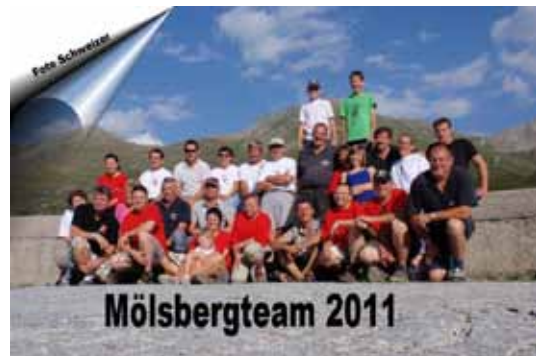
Impressionen von der heurigen Mölsbergmesse